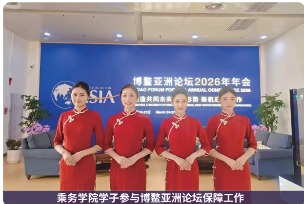
乘务学院学子参与博鳌亚洲论坛保障工作