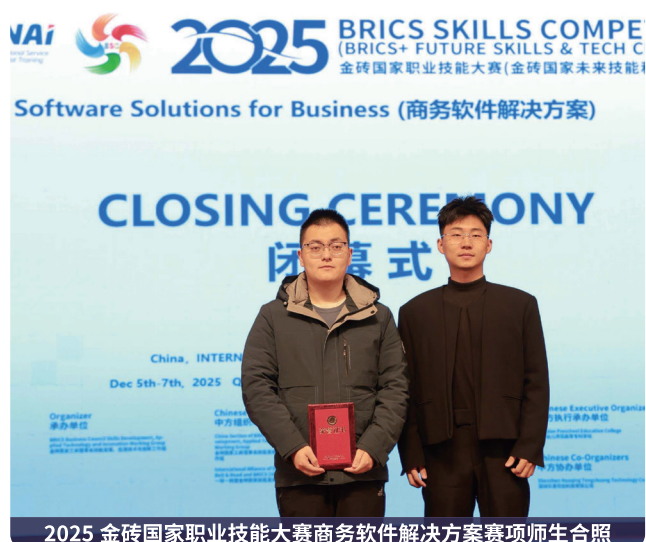
2025 金砖国家职业技能大赛商务软件解决方案赛项师生合照