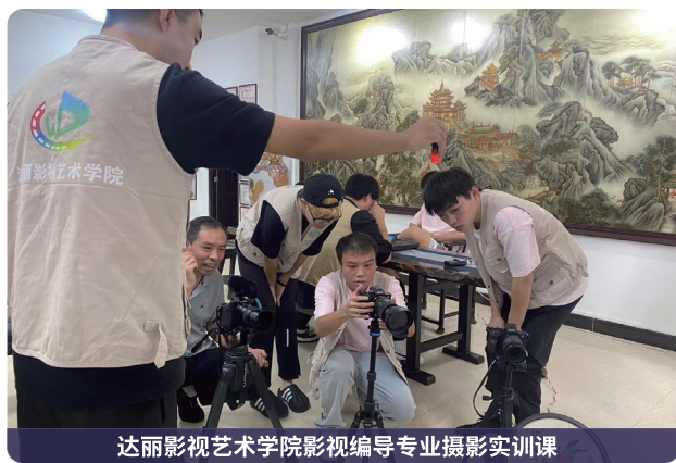
达丽影视艺术学院影视编导专业摄影实训课