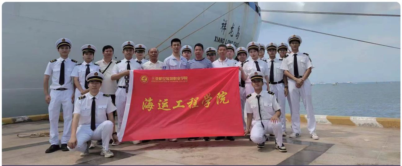
航海技术专业实践教学参观活动

海运工程学院于 2010 年设立，是学校打造“两航一游”专业群重点建设学院。学院通过了交通运输部海事局船员教育和培训质量体系审核并取得资质，获准开展海船船员教育和培训，开创了海南省自主培养高层次航海人才的先河。学院投资 3900 多万建成了航海、轮机和水上训练三大实训中心，建成了国内先进的 360°全景航海仿真模拟器和 30 万吨级超大型油轮仿真轮机模拟器以及 GMDSS、海图作业、航海仪器、船舶动力装置、船舶电子电气、电子海图等专业实验室。学院引进高级船长、船长、轮机长、大副、大管轮等高层次航海人才，组建培育了一支既有丰富航海工作经历、又有多年教学经验的双师型团队。学院开设航海技术和轮机工程技术两个骨干专业，并开展海船三副、三管轮、值班水手、值班机工等船员培训，服务海南自贸港建设、面向国际培养并输送高素质航海人才。