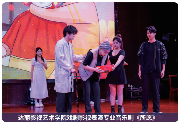
达丽影视艺术学院戏剧影视表演专业音乐剧《所愿》