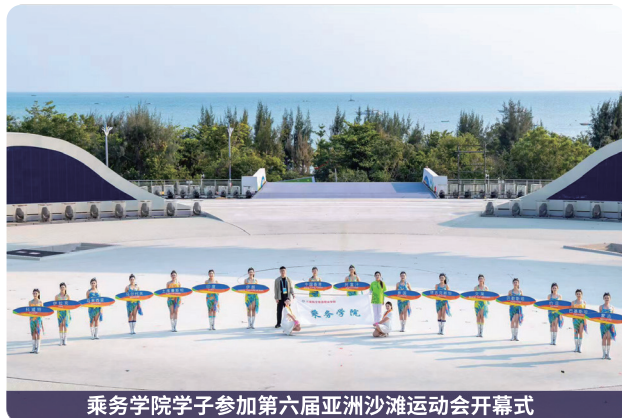
乘务学院学子参加第六届亚洲沙滩运动会开幕式