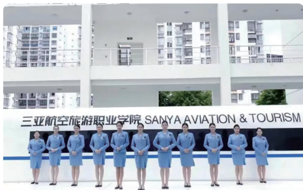
高速铁路客运服务专业学生职业形象展示