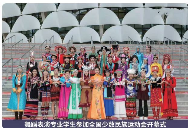
舞蹈表演专业学生参加全国少数民族运动会开幕式