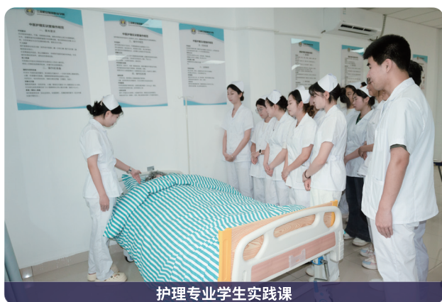
护理专业学生实践课