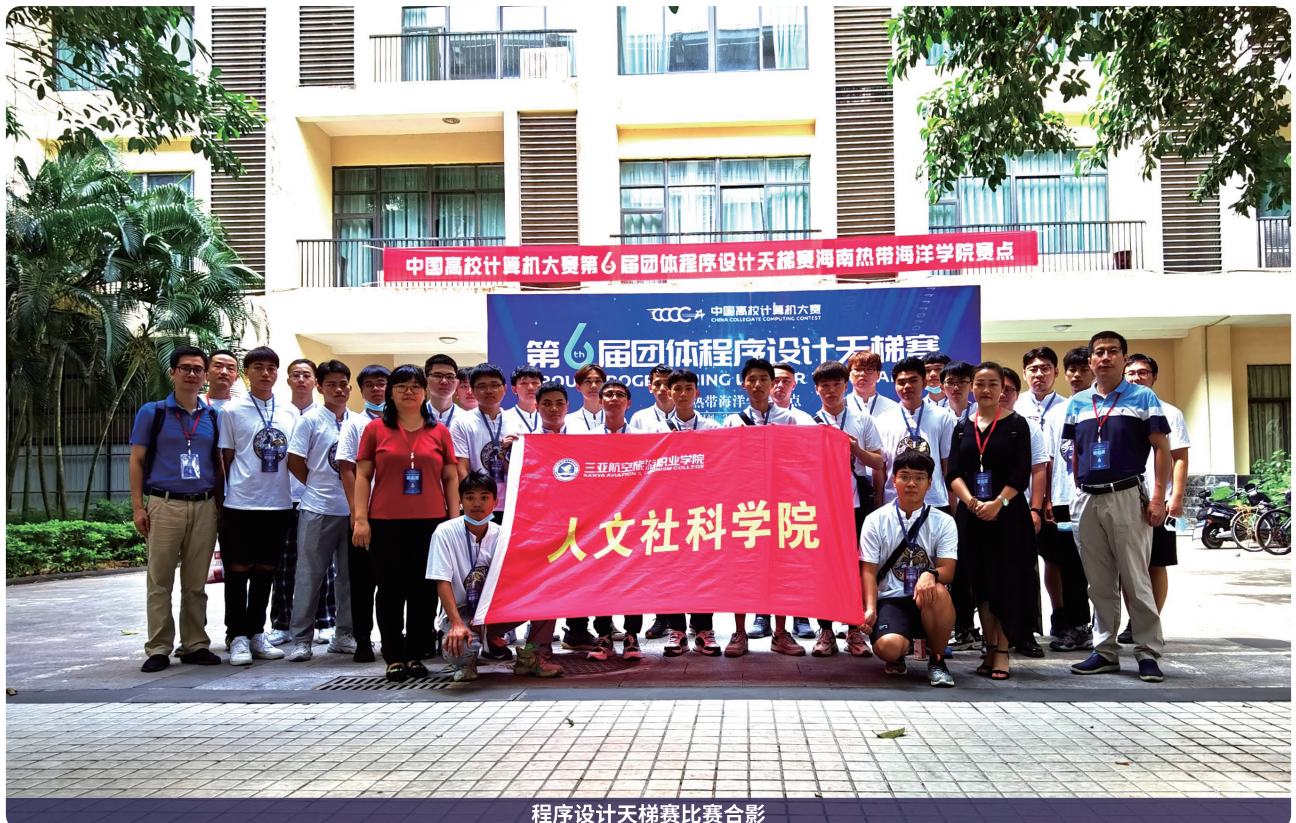
程序设计天梯赛比赛合影

近两年来，学院师生在学科竞赛与科研领域成果丰硕：教师获国家级教学奖项9项、省级15项；学生在全国及海南省职业院校技能大赛等赛事中，斩获国际级1项、国家级20项（含金奖3项）、省级76项（含一等奖14项）。科研成效显著，新获批国家级课题1项、省级10项，完成结题15项、在研17项，出版校企双元教材2部，发表学术论文59篇（含EI检索32篇、SCI检索1篇），人才培养质量与实践创新能力获社会广泛认可。