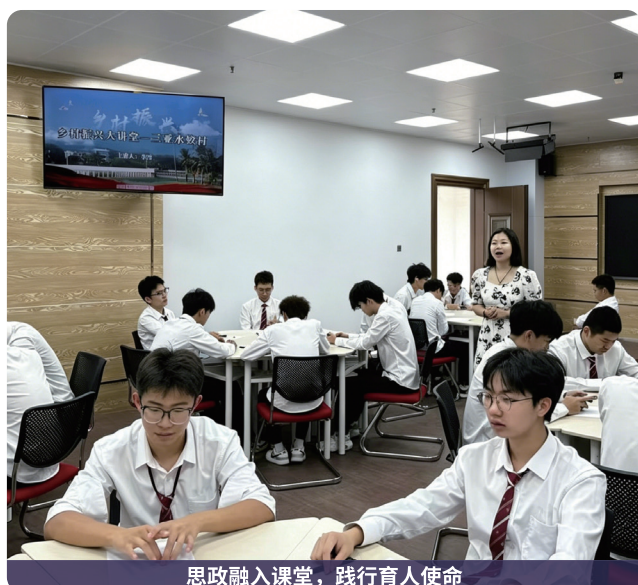
思政融入课堂，践行育人使命