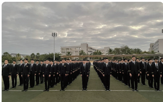
民航空中安全保卫专业学生实训课